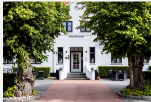
Hotel Scheelsminde Aalborg