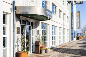
Pier 5 Hotel Aalborg

Dobbeltværelse 875,- Dobbeltværelse m. terrasse 995,-