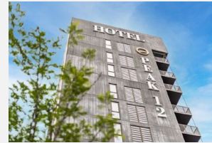
Peak 12 Hotel Viborg