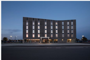
Aalborg Airport Hotel Nørresundby

Enkeltværelse 790,- Dobbeltværelse 895,- Superiorværelse 1105,-